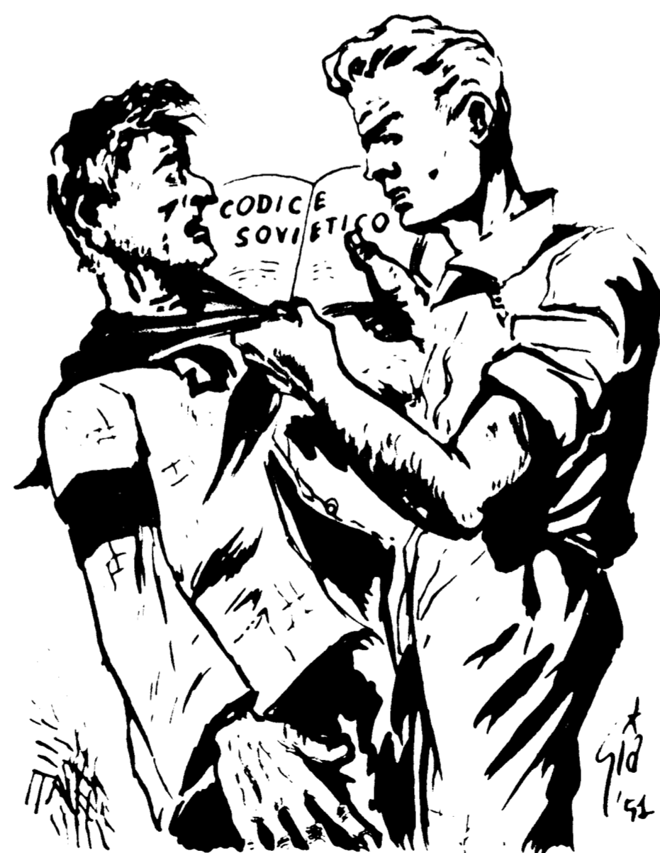
Comunisti in buona fede! Mettete sotto gli occhi del capocellula questi dati. Sono scritti sui giornali e sui codici sovietici.

La Russia è un paese ricco, il suo bilancio è in attivo, ma lo stato comunista spende i suoi miliardi per COSTRUIRE ARMI e per mantenere con enormi stipendi i gerarchi del partito. Il direttore di una fabbrica prende circa 14 volte di più dell'operaio. - È PER QUESTO CHE GLI OPERAI RUSSI GUADAGNANO MOLTO MENO DEGLI OPERAI ITALIANI.