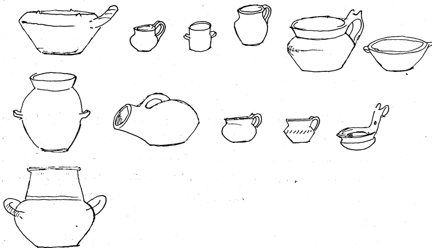
Tipologia dei vasi preistorici scoperti a Guaceto.

In epoca imprecisata questo villaggio fu abbandonato. Fu abbandonato forse improvvisamente perchè sono stati trovati nel corso dei saggi numerosi vasi intatti, oggi conservati al Museo Provinciale. A me pare strano che venissero abbandonati vasi ancora utilizzabili, in un'epoca in cui certi manufatti erano prezio-