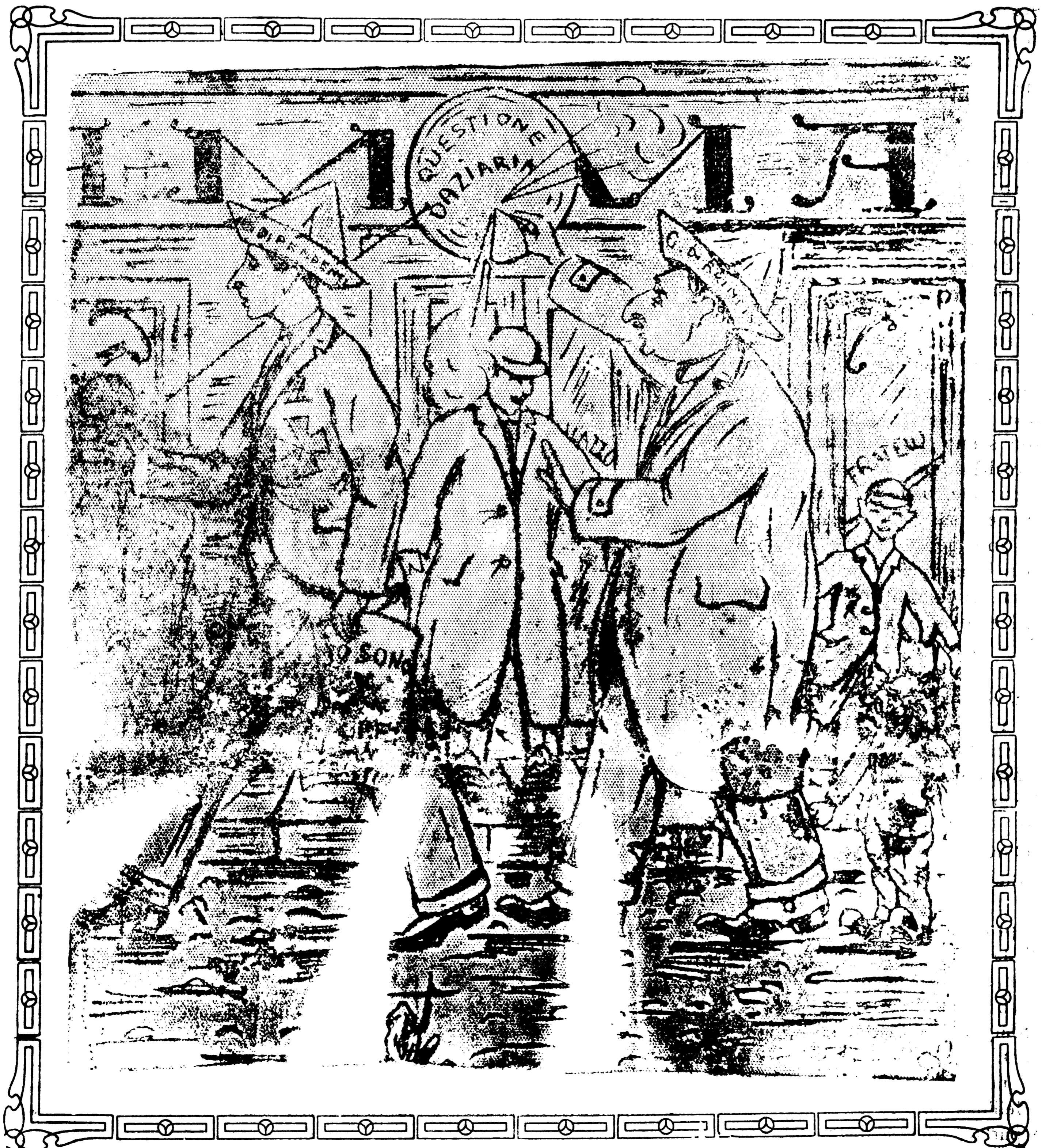
Storiella senza parole