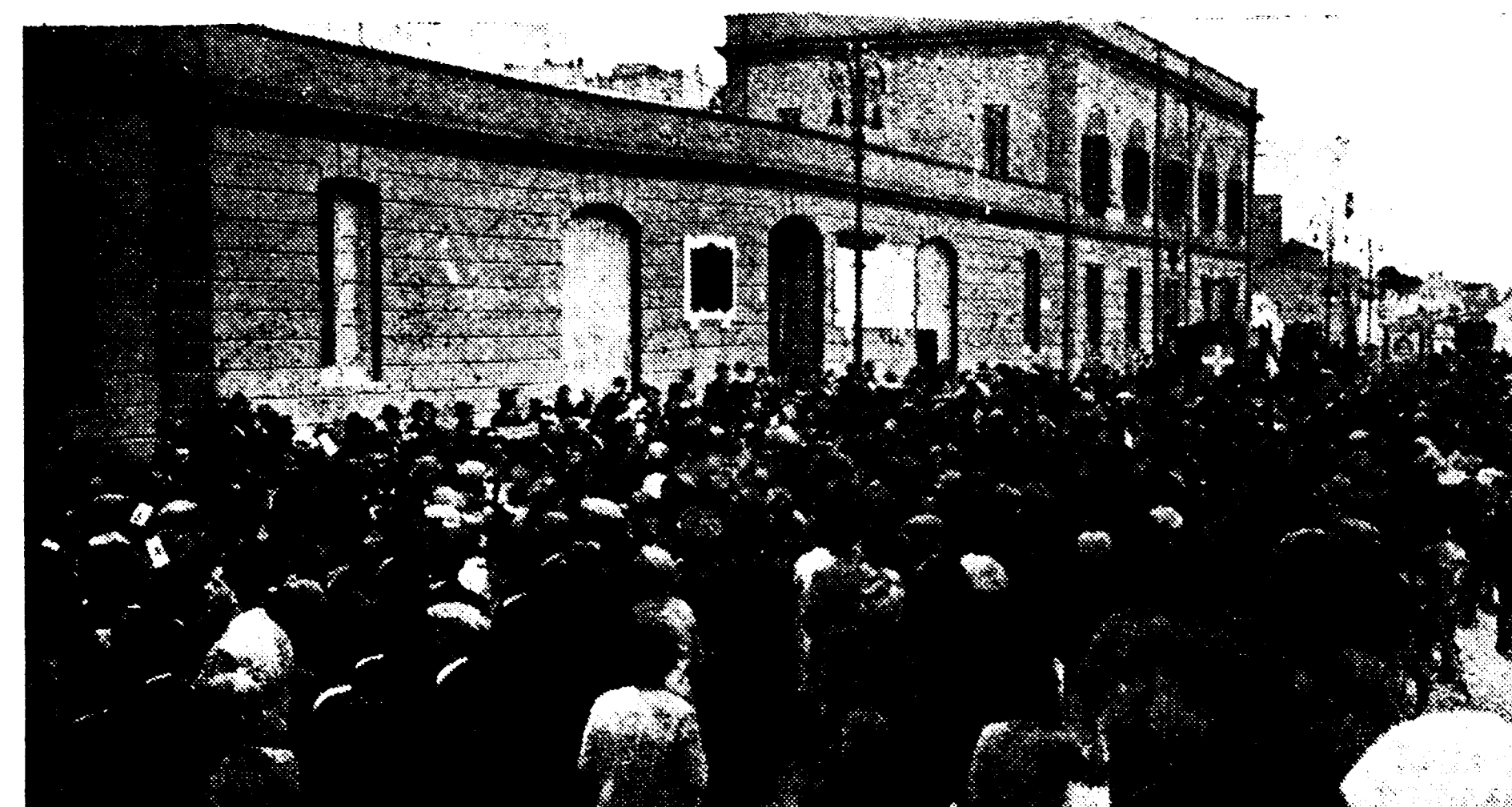
Il grandioso corteo giunge sulla banchina. L'omaggio delle forze baillistiche.

«Al grido di evviva il DUCE nostre forze lavoro fusione volente Patria fascista si imbarcano per Africa Orientale fiere redimere la terra per nostra espansione. Federale Brindisi».