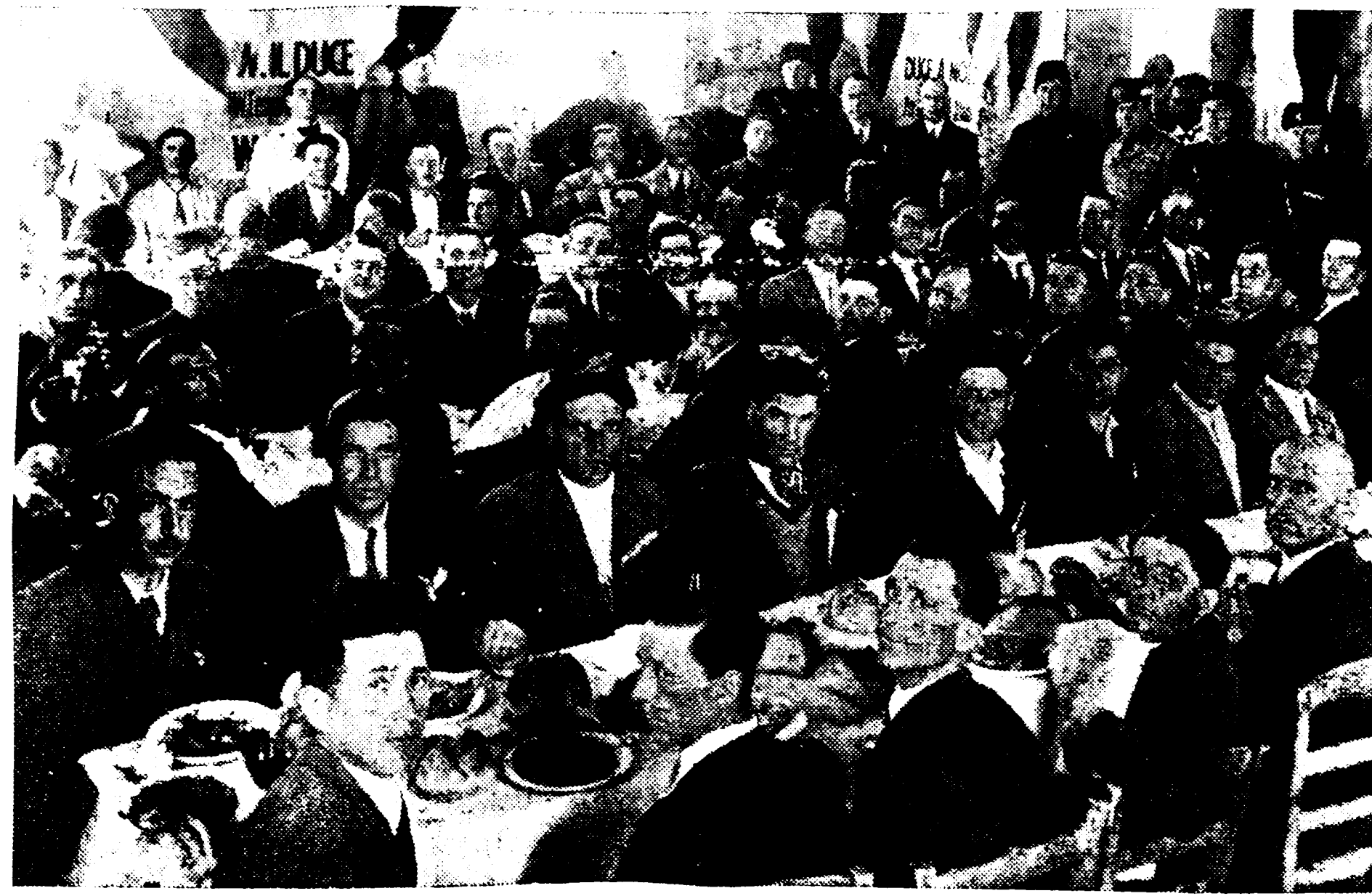
Le Autorità assistono al rancio offerto dalla Federazione dei Fasci di Combattimento agli operai partenti.

Nella sala opportunamente addobbata con una grande effigie del Duce, con bandiere e striscioni inneggianti al Duce, alla Patria ed alle sue Colonie, i lavoratori, che avevano tutti il petto fregiato da una coccarda tricolore con la leggenda «Viva il Duce», presero posto dinanzi alle mense imbandite inneggiando a Colui che guida con mano ferma i destini della Patria. Al rancio assistettero S. E. il Prefetto, il Segretario Federale, l'Ispettore del Commissariato per le Migrazioni Interne giunto per l'occasione e tutti i membri del Direttorio Federale. Particolare significativo: i lavoratori non sapendo come esprimere la loro riconoscenza al rappresentante del Duce raccolsero