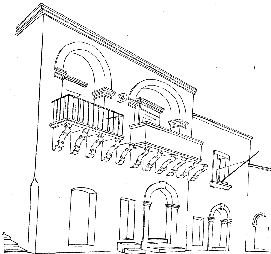
BRINDISI — Case alle Sciabiche.

CARLO CESCHI — ARCHITETTURA MINORE IN PUGLIA