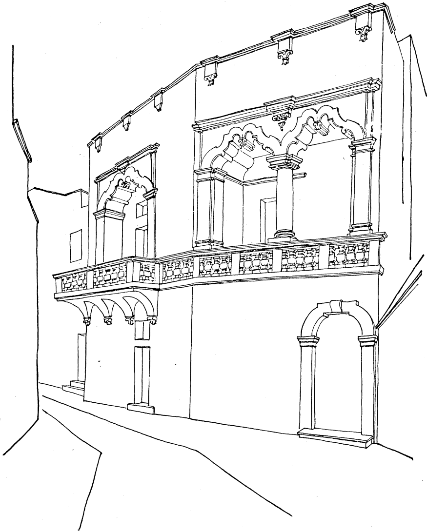
ORTA — Loggia barocca.

CARLO CESCHI — ARCHITETTURA MINORE IN PUGLIA