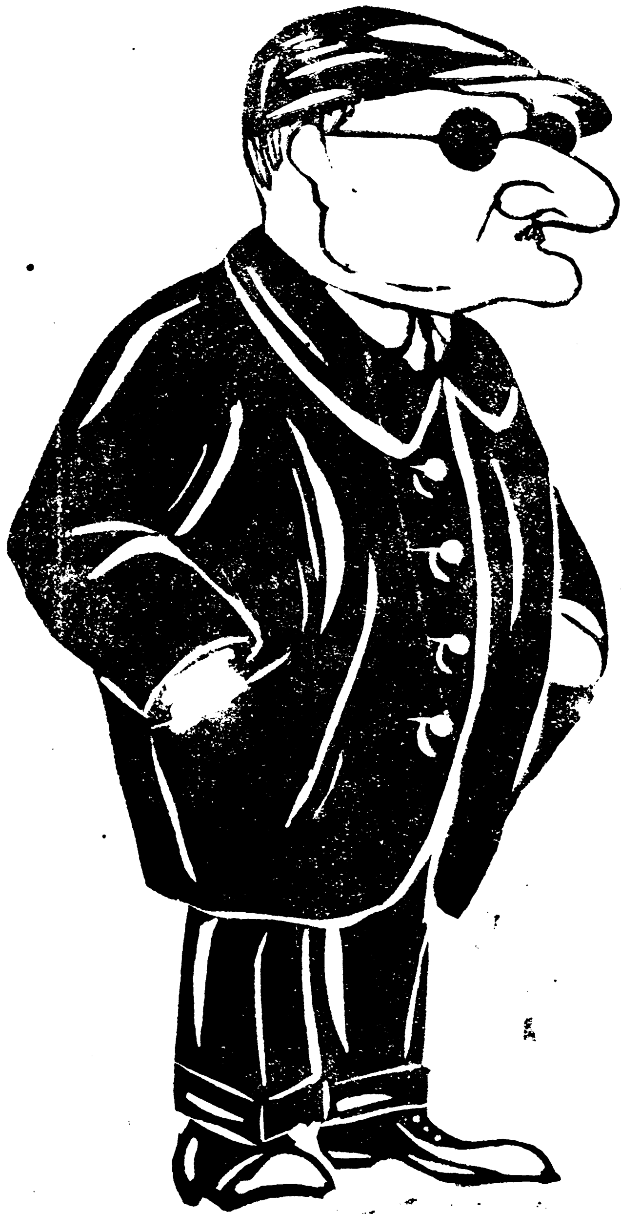
Una colonna della finanza brindisina