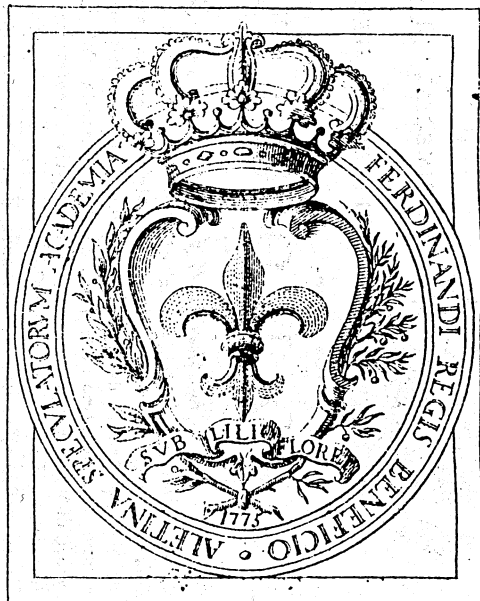
Ill. ne 1 - Stemma dell'Accademia degli Speculatori