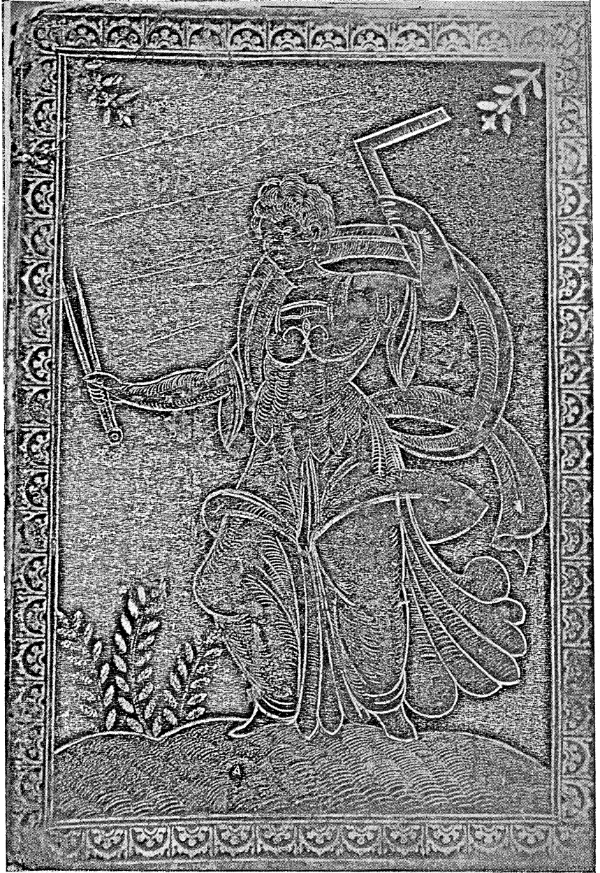
Fig. 6. — Rilegatura a figura della fine del secolo XVI.