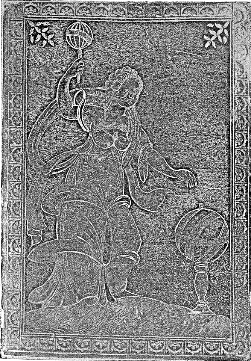
Fig. 5. — Rilegatura a figura della fine del secolo XVI.